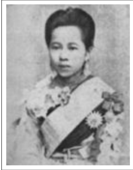
พระวิมาดาเธอ กรมพระสุทธาสินีนาฏ ปิยมหาราชปดิวรัดา (พระอัครชายาเธอ พระองค์เจ้าสายสวลีภิรมย์ พระอัครชายาพระองค์เล็ก หรือท่านองค์เล็ก)

พระอัครชายาเธอพระองค์กลาง และพระอัครชายาเธอพระองค์เล็ก หรือ บางทีก็ย่อลงเป็นท่านพระองค์ใหญ่ ท่านพระองค์กลาง และท่านพระองค์เล็ก