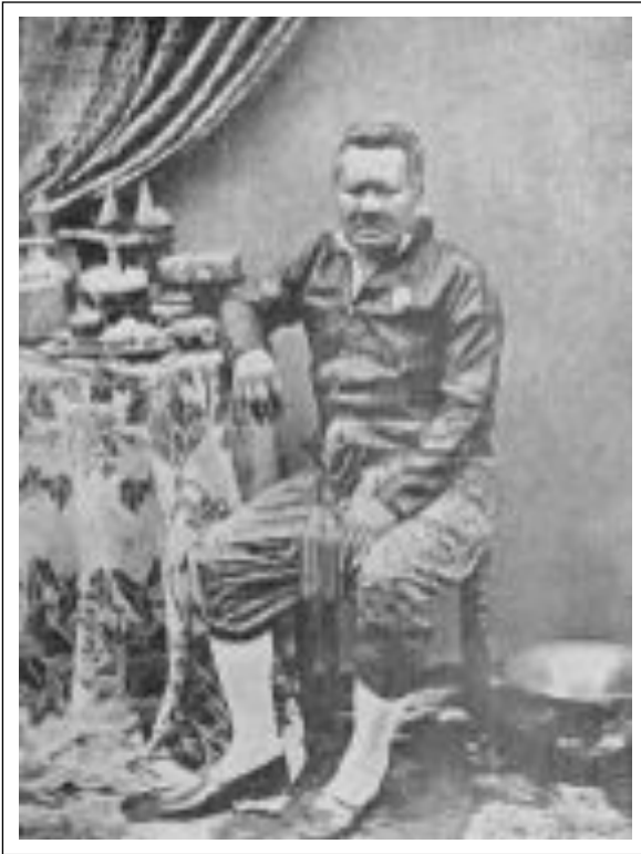
พระเจ้าบรมวงศ์เธอ กรมหมื่นภูมินทรภักดี (พระองค์เจ้าลดาวัลย์) ฉายในรัชกาลที่ ๕ ก่อนสิ้นพระชนม์เพียง ๒ ปี เครื่องแต่งพระองค์ ตามพระราชนิยมในรัชกาลที่ ๔ ต่อมาถึงต้นรัชกาลที่ ๕

ต่อเมื่อหมดยศหน้าชื่ออันแสดงว่าเป็นเชื้อสายราชสกุลแล้ว ลงมาเป็น เด็กชาย เด็กหญิง นาย และนางสาว แล้วจึงใช้คำว่า ‘ณ อยุธยา’ เพื่อ แสดงว่าเป็นนามสกุลอันเป็นราชสกุล